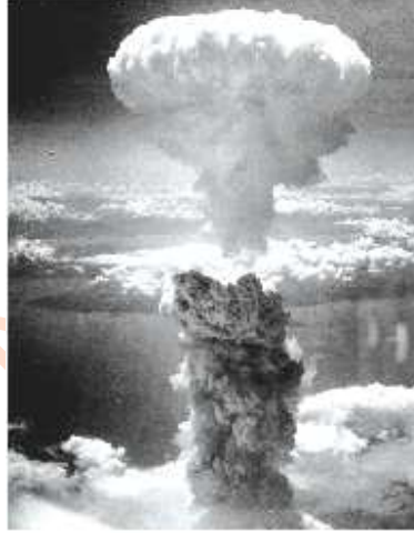
చిత్రం 12.9: నాగసాకి మీద అణు బాంబు