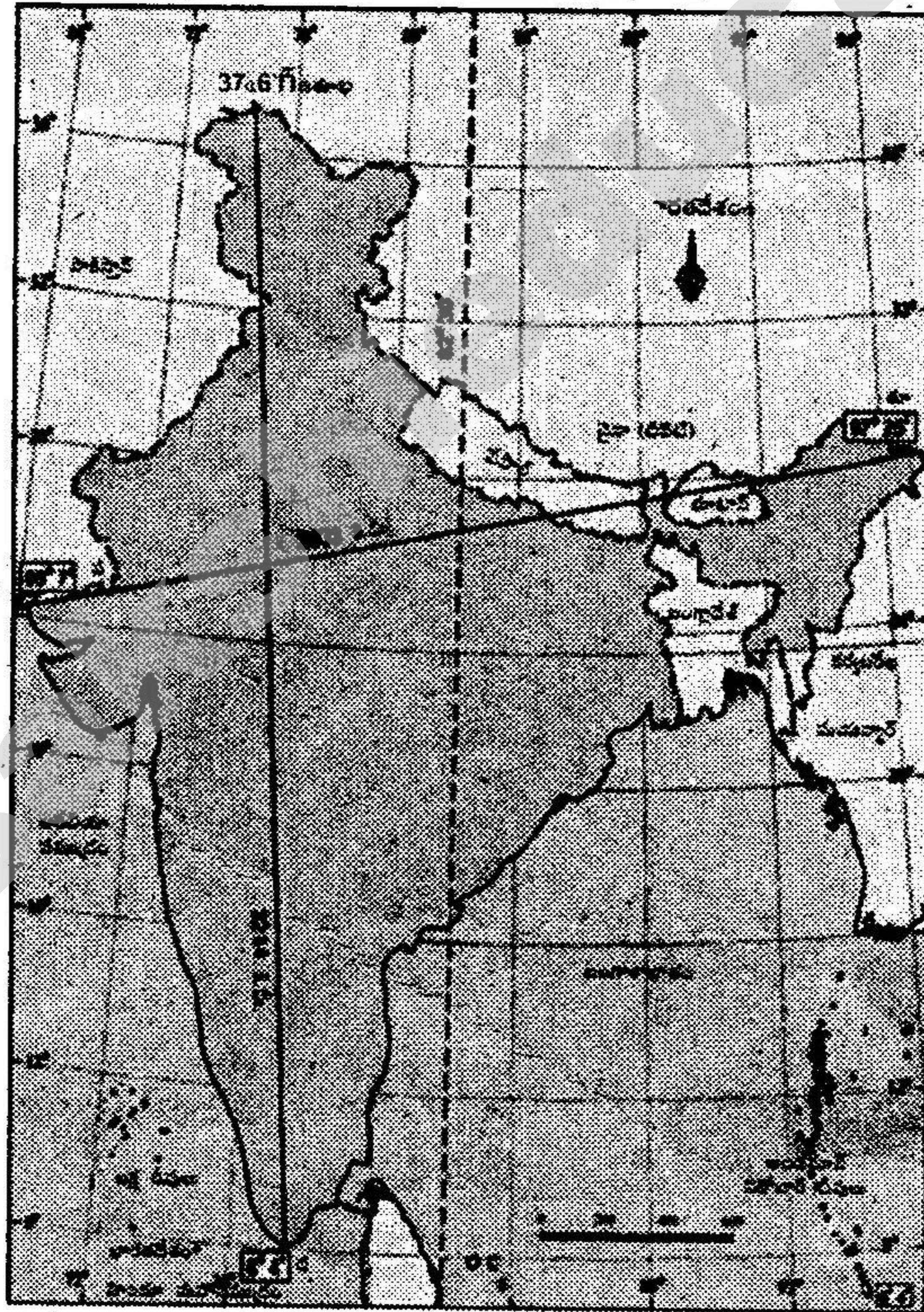
పటం : భారతదేశం-ఉత్తర దక్షిణ, తూర్పు-పడమరల విస్తీర్ణం, ప్రామాణిక రేఖాంశం

★ కింది పటంను చదివి 6, 7 ప్రశ్నలకు సమాధానములు రాయుము.